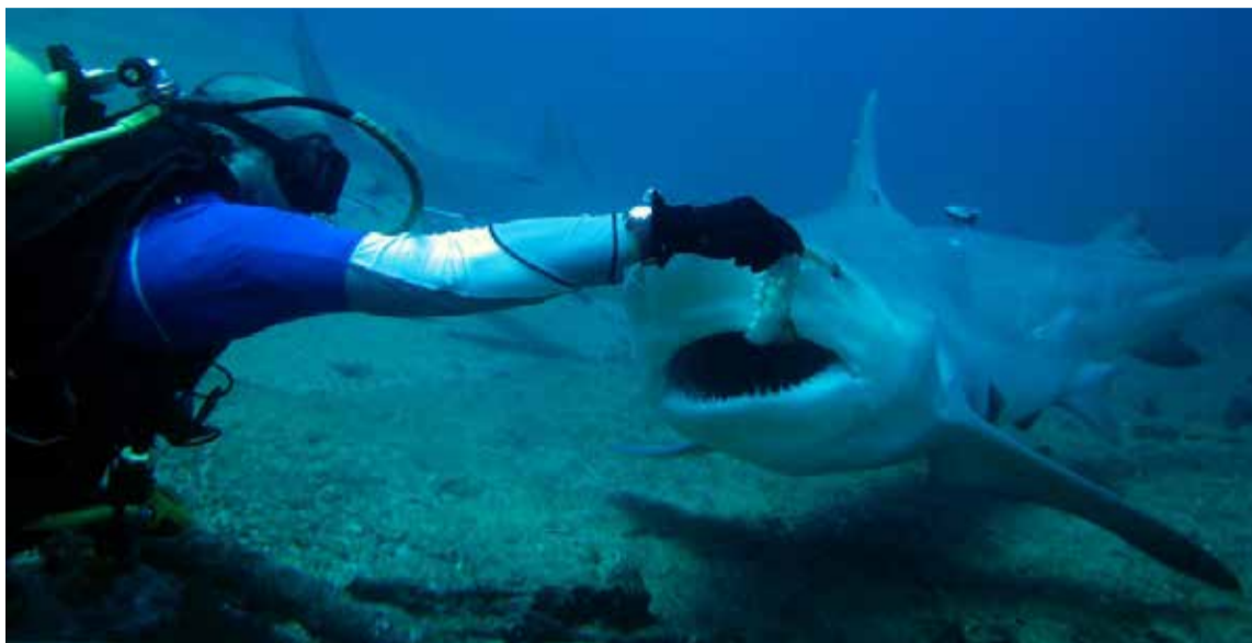
La especie, de la familia Odontaspidae, caracteriza por su cuerpo macizo, las dos grandes aletas dorsales, los dientes sobresalientes.

Generalmente concurren entre tres y cuatro instructores de la Marlin para certificar el bienestar de los clientes, quienes desde las profundidades del mar contemplan en su medio natural a