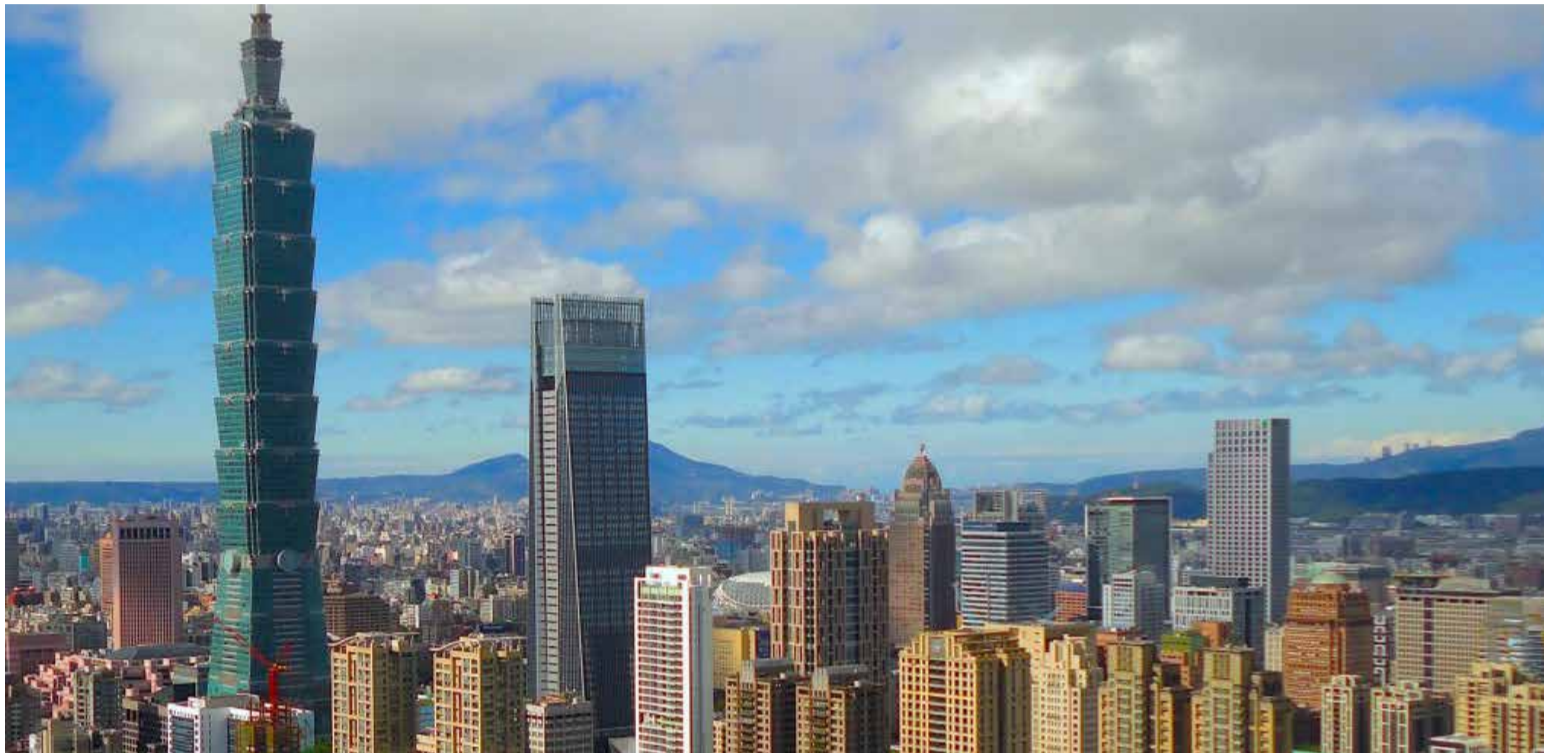
Taiwán ha celebrado nuevamente su fecha nacional el pasado 10 de octubre. Ese día de 1911 fue derrocada la dinastía Qing.

T aiwán ha celebrado nuevamente su fecha nacional el pasado 10 de octubre. Ese día de 1911 fue derrocada la dinastía Qing y establecida la República de China, cuyo Gobierno tuvo que trasladarse a la Isla de Formosa (Taiwán) en 1949, tras la ocupación del continente chino por Mao Tse-tung. Esta fecha clásica ocurre en medio del sometimiento en buena parte del mundo al virus, amablemente denominado «Covid 19».