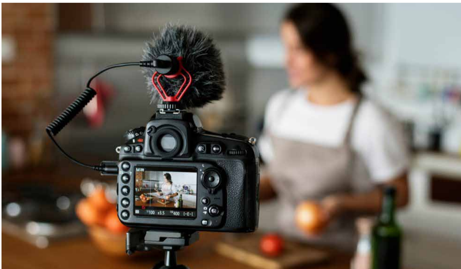
Cámara para grabar

«La era de la transformación digital nos ha dejado una cosa en claro: la importancia de los medios de comunicación es fundamental. En una época de fake news, grandes monopolios informativos o presión de Gobiernos por concentrar espacios noticiosos hace que la cada vez mayor segmentación de los públicos abra espacios de nicho para audiencias que están ávidas por consumir información veraz y de