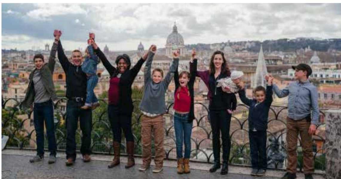
Viajar en familia

Santa Marta: La segunda ciudad más antigua de América del Sur y la primera de toda Colombia cuenta con parques naturales y una biodiversidad que te dejarán sin aliento. Belleza en estado puro. Además de sumergirse en la naturaleza del Parque Natural Tayrona, las más pequeñas también adorarán el