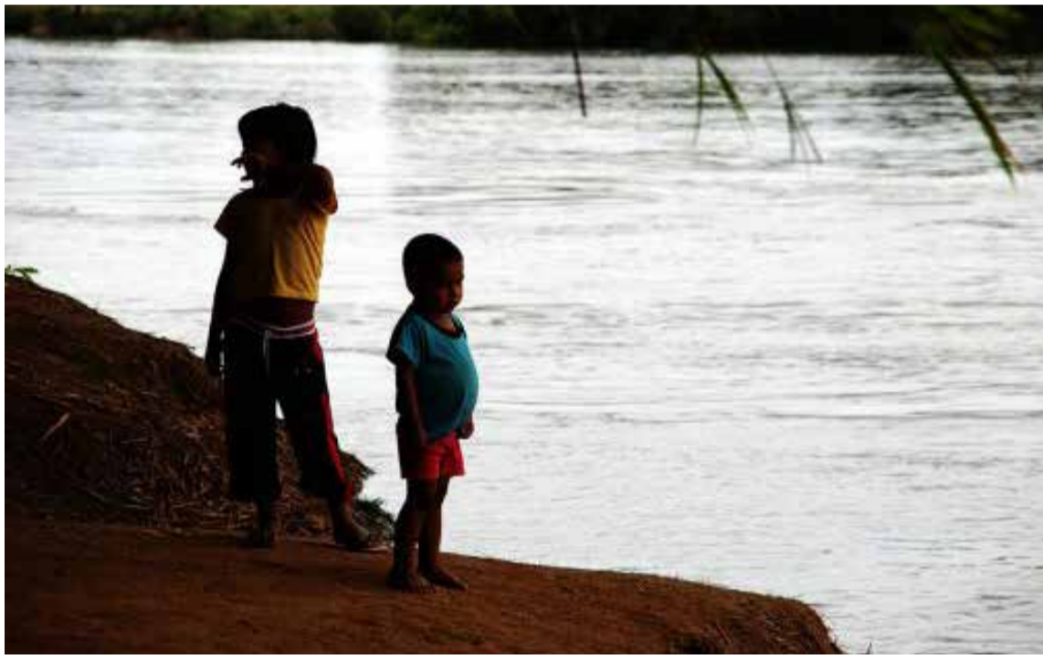
De 1.065 niños en Arauca, el 19 % presentó índices de talla baja y el 18 % tiene riesgo de obesidad.

En el departamento de Arauca residen 34.000 venezolanos, el 65 % de ellos (22.113) en su capital. Dichos migrantes han llegado en busca de mejores condiciones socia-