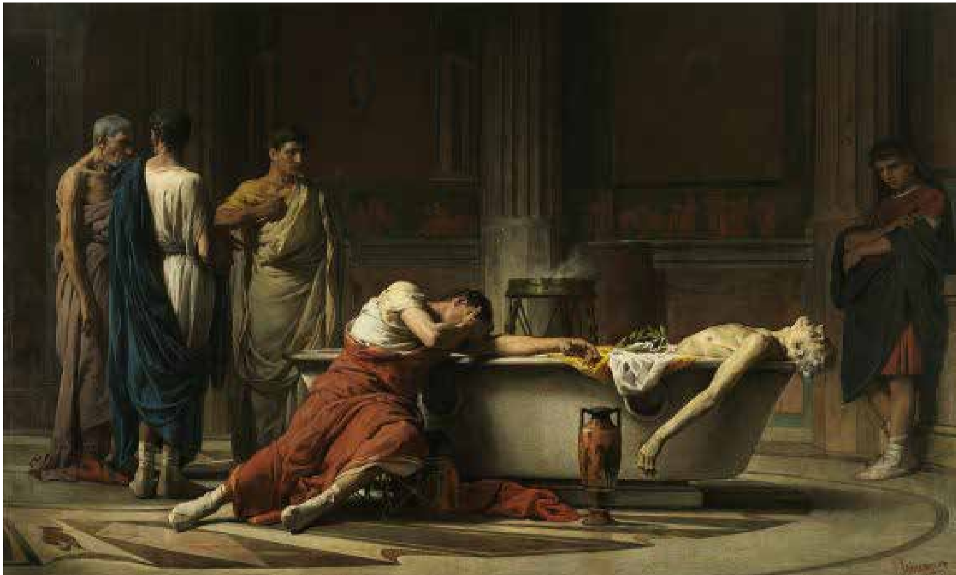
La muerte de Séneca

D e acuerdo con la Organización Mundial de la Salud (OMS), el 1% de las muertes globales son suicidios, lo que significa que son más las personas que fallecen cada año por suicidio que por VIH, malaria, cáncer de mama, o por guerras y homicidios.