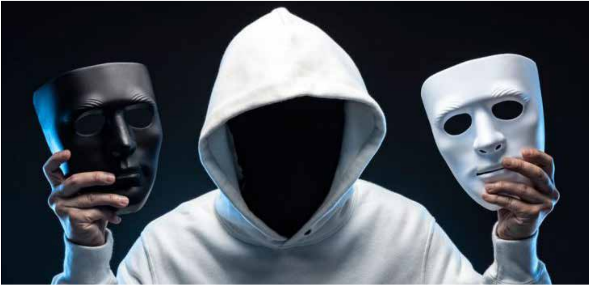
Las diversas caras que muestra los políticos a los electores

El psicópata o sociópata necesita desestabilizar siempre las cosas aquí y allá.