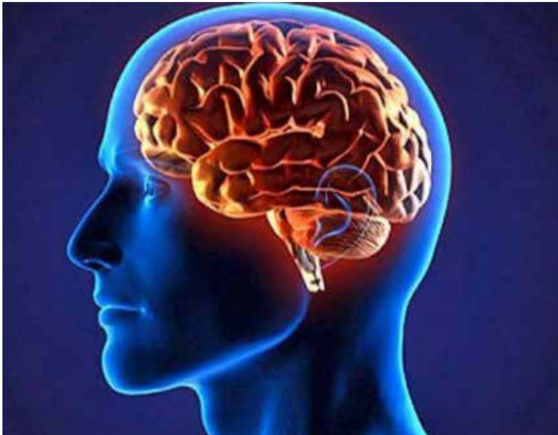
Dos investigaciones en universidades de Europa y Estados Unidos llegaron a una conclusión similar: el gen que nos separa de otros primates apareció en nuestro cerebro hace unos 3 o 4 millones de años.

«Este gen, NOTCH2NL resaltaba en el cerebro de los humanos, pero no