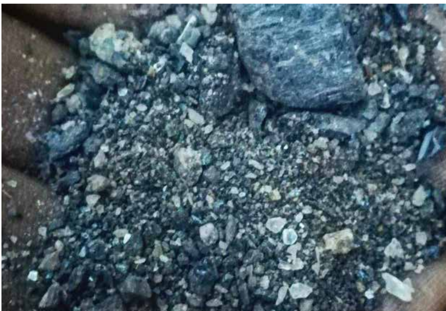
Coltán denominado El Oro Azul.