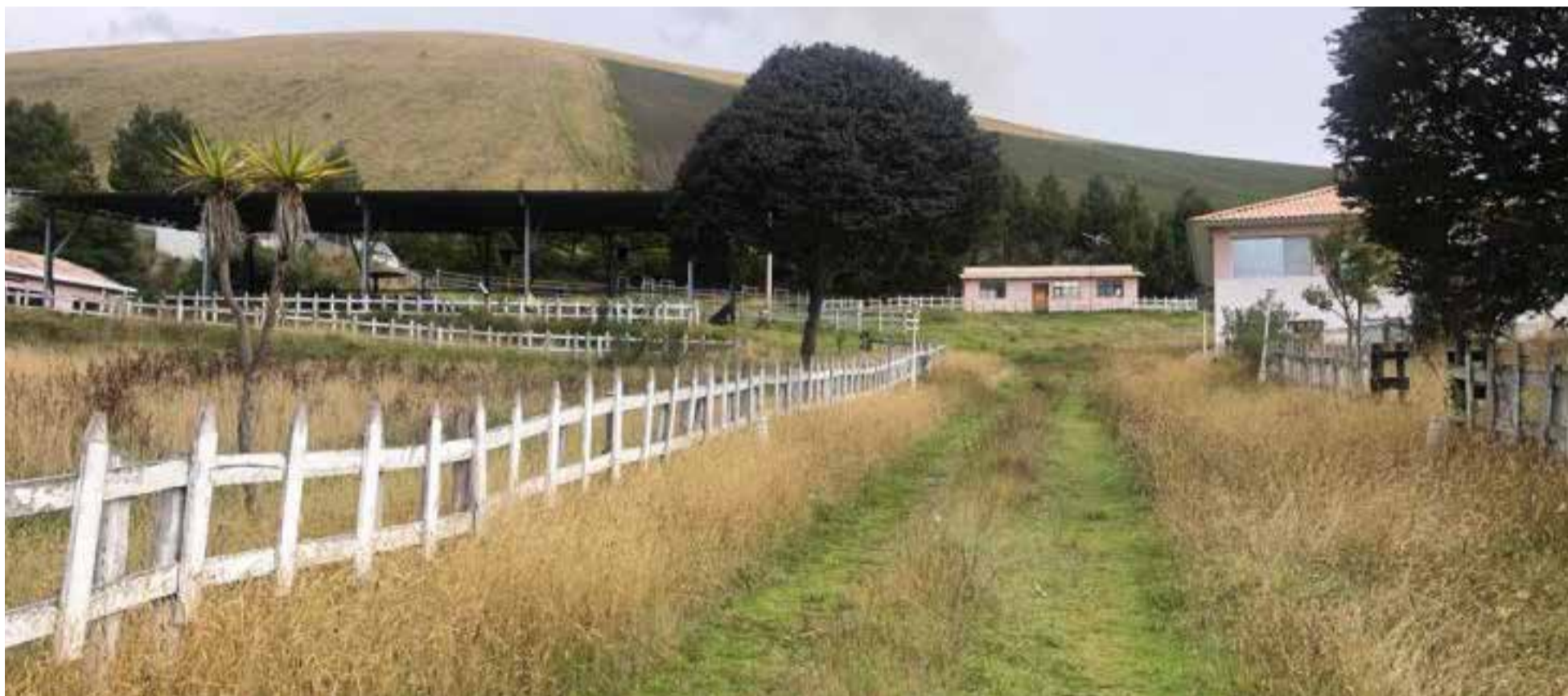
Tierras para campesinos colombianos

La Agencia Nacional de Tierras (ANT) y la Sociedad de Activos Especiales (SAE) firmaron un convenio estratégico para acelerar la Reforma Agraria en Colombia, valorado en 600.000 millones de pesos.