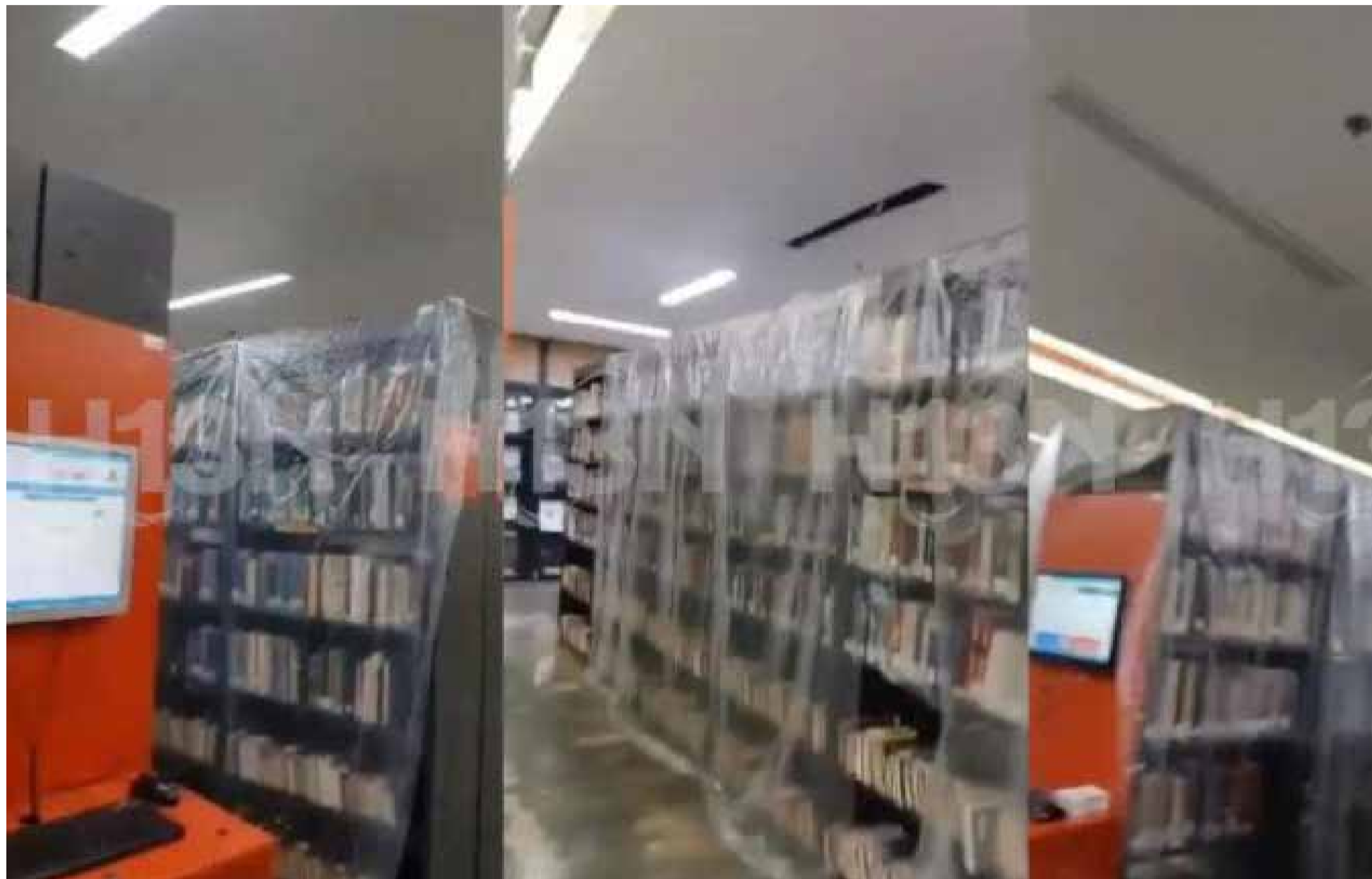
Biblioteca Pública Piloto de Medellín