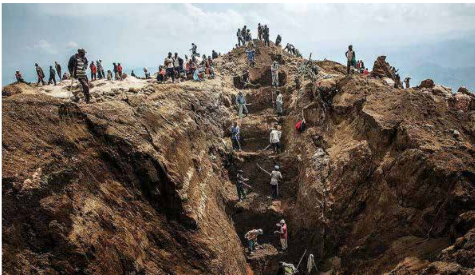
Minas de coltán a cielo abierto

Las operaciones ilegales de extracción en estas áreas han sido históricamente vinculadas a las disidencias de las FARC, que utilizan los ingresos para sostener sus actividades.